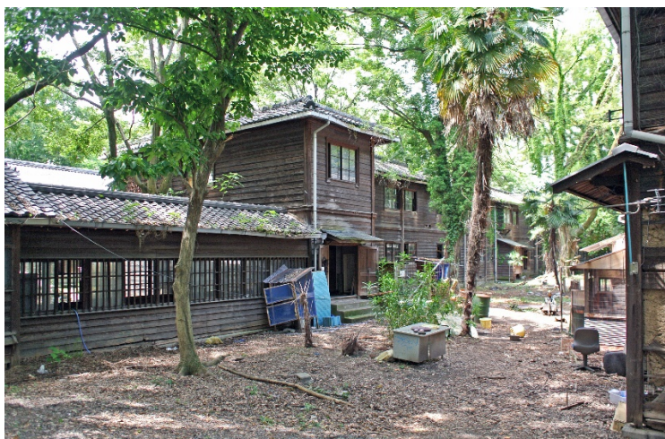
吉田寮中寮