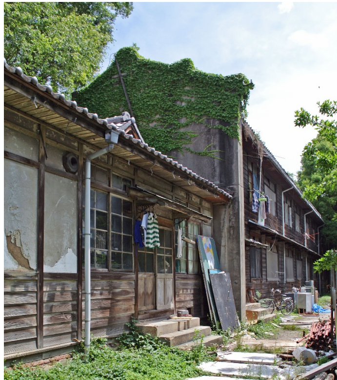
吉田寮管理棟・南寮外観（撮影. 石田潤一郎）