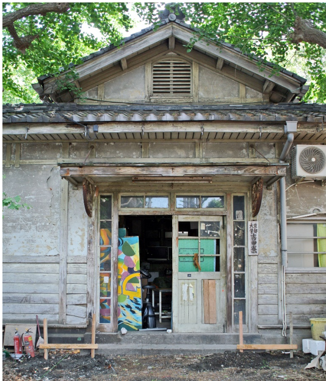
吉田寮玄関