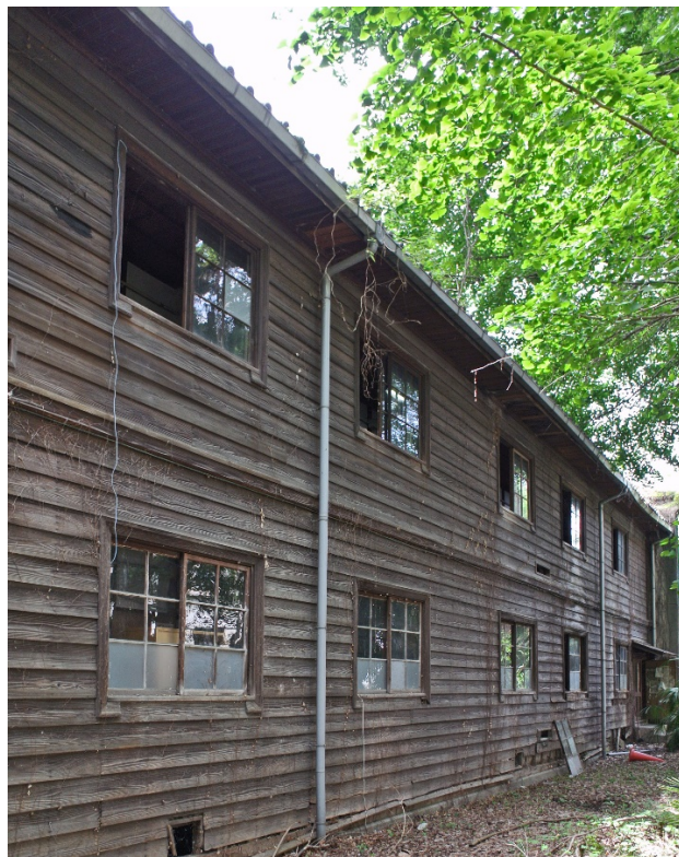
吉田寮北寮外観