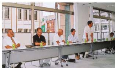
▼事務区長のみなさん (写真下)大規模・中規模小売店のみなさん(前列右から、ショールプラザ、イトーヨーカ堂上尾店、キンカ堂上尾店の各担当者)