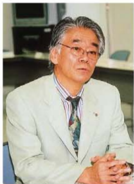
▲「みなさんから出された意見をそれぞれが持ち帰り、何ができるかを再検討して、次の機会へつなげていきたい。今後も定期的にこうした場を設けていく予定です」(商工会議所・山崎商業振興委員会委員長)

また、市、商工会議所を核とする関係団体、商店街の責務も明記され、互いに連携・協力し合いながら、商業の振興と地域社会の活性化に努めることが定められています。