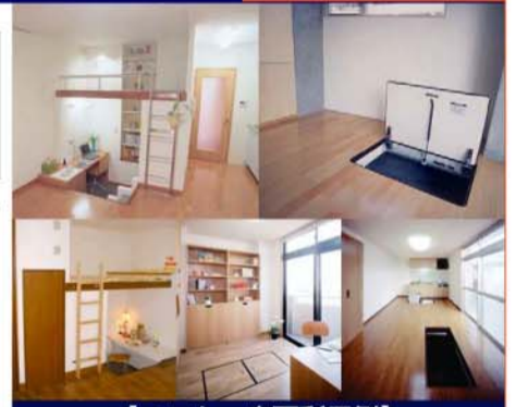
【ロフト・床下利用例】