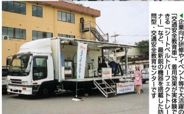
▲企業向け研修やイベント等で大活躍の「交通安全教育車」。着用効果が実体験できるシートベルトパフエクトトレーナー」など、最新鋭の機器を搭載した訪問型・交通安全教育センターです