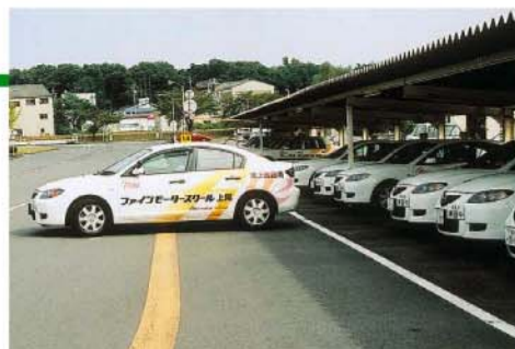
▲9月から新型教習車(AT・マツダ「アクセラ」)を導入。走りやすさ抜群で、技能教習が楽しく、やる気もアップ!