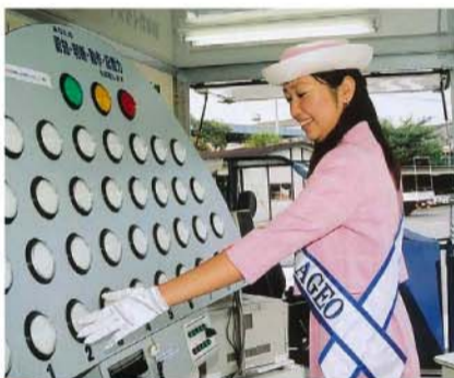
▶ドライバーチェック&トレーナー「点検くん」が認知・判断・動作・記憶の運動能力をゲーム感覚でスピーディに検査します

川上 免許取得後、1年以内に無料で技能教習が受けられる「アフターケアサービス」も独自に実施しています。また、高齢者講習や初心運転者講習、「交通安全教育車」による企業向け研修など、免許取得者への再教育にも力を入れています。地域の交通安全教育センターとして「交通安全フェスティバル(教習所1日開放イベント)」