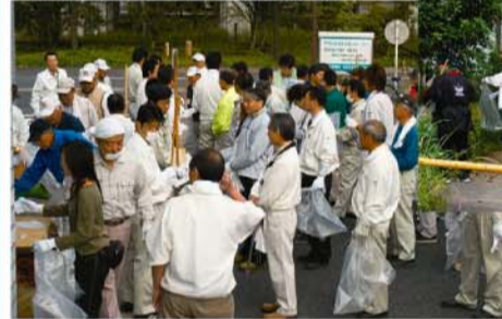
▲子供たちも一生涯懸命お手伝いしてくれました