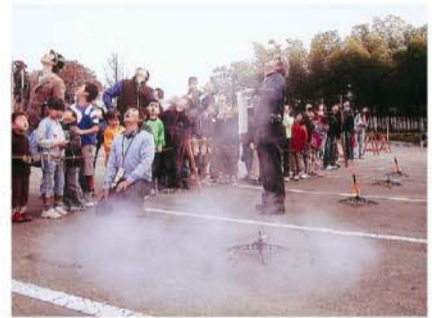
▲実験教室「モデルロケット発射」