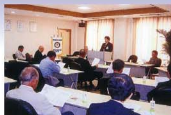
▲例会で伊奈病院にて健康の講話を聴く

国際ロータリーの歴史は1905年にアメリカのシカゴで産声を上げて以来100年余の歴史を持ち、その奉仕活動の一例を挙げれば、国連の世界保健機構のポリオ撲滅運動を支援する最大の組織で、その撲滅には一歩手前までできていると言われています。