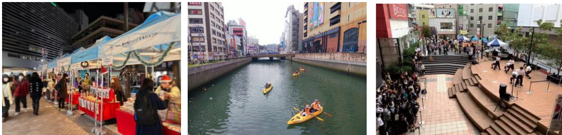
横浜西口エリアマネジメントの過去の取り組み

※「横浜西口マネジメント」について： https://www.yokohamanishiguchi.or.jp