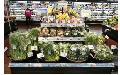
〈地場野菜のコーナー〉