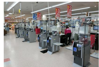
〈お支払いセルフレジ〉