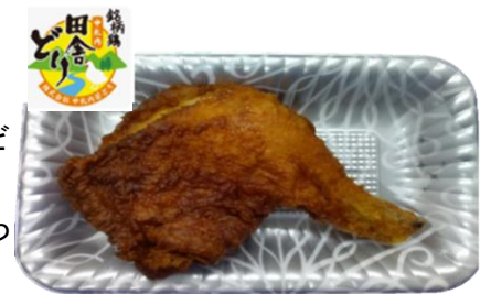
〈中札内田舎どりフライドレッグ〉