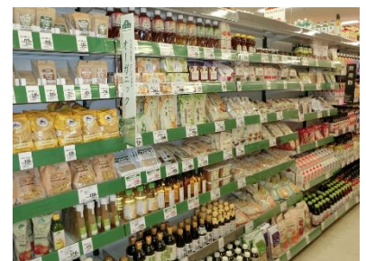
〈オーガニックコーナー〉