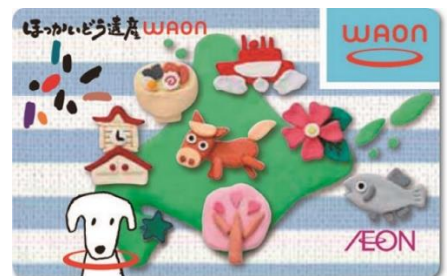
〈ほっかいどう遺産WAON〉

北海道とイオン株式会社は、双方が持つ資源を有効に活用し、北海道の一層の活性化と道民サービスの向上に協働して取り組むことを目的に、2011年7月に包括連携協定を締結し、その取り組みの一つとしてご当地WAON「ほっかいどう遺産WAON」を発行しています。このカードをイオングループ各店舗やWAON加盟店で利用していただくことにより、その利用金額の一部を北海道遺産協議会に寄付し、各地の北海道遺産を次の世代に引き継いでいく活動に役立てていただいております。