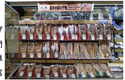
〈能本水産 干物各種〉