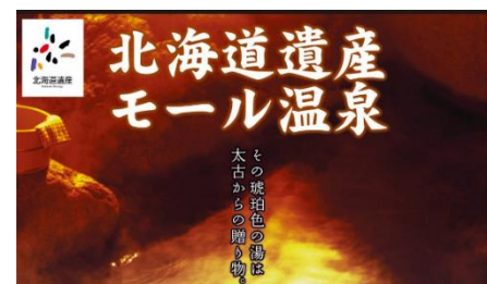
〈音更町十勝川温泉モール温泉〉

なお、音更町十勝川温泉の「モール温泉」も北海道遺産に登録されており、「ほっかいどう遺産WAON」を通じて当社も応援しています。