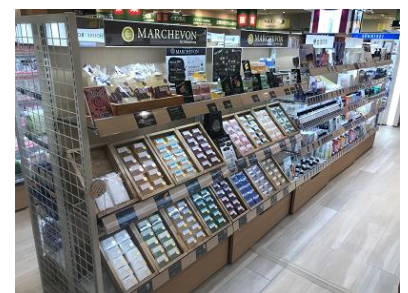
〈ナチュラル&オーガニック〉