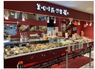
〈惣菜 美唄焼鳥 炎〉