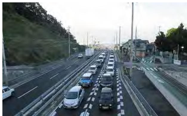
写真:西戸田交差点の交通状況 (H28.10 AM7時台 北から南へ撮影)