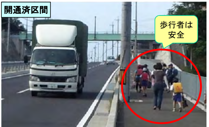
撮影日：平成25年6月5日(水)