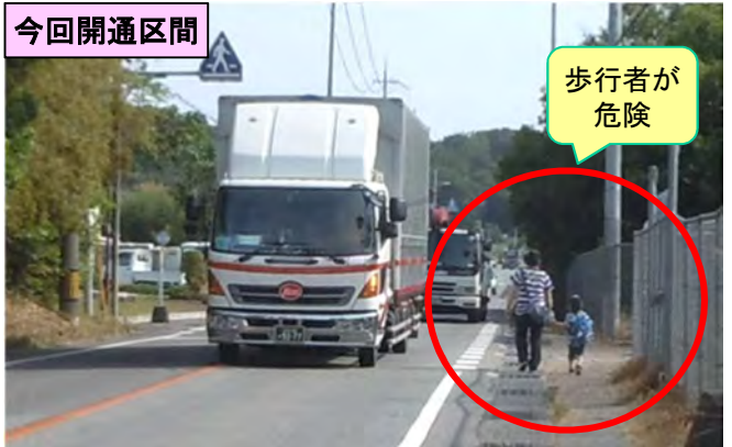
撮影日：平成25年6月5日(水)