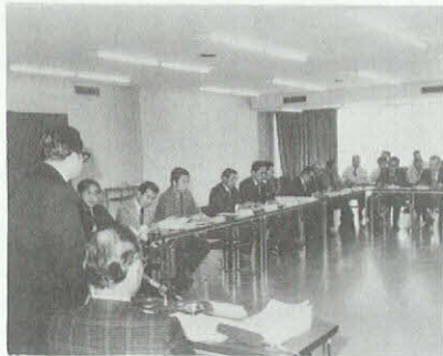
国1 問題対策協議会

国際児童年記念事業として、児童美術館を含め本年度施行中の集会施設と一体化した岡崎市文化センターを建設しますが、地下一階部分を駐車場とし、五階建延べ四千二百四十八平方メートルの和風大小会議室も備え、百五十台収容の駐車スペースを確保した近代施設で、完成の暁は、音楽、演劇、文化教室、社