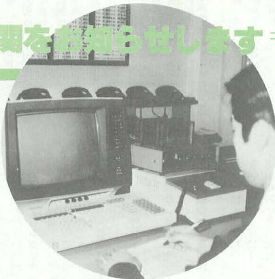
表示装置で情報処理

市民の皆さんの「いのちと健康」を守るため、救急医療情報センターが三月三十一日から業務を開始しました。 県医師会が運営にあたっている救急医療情報センターは、医療機関の救急患者の受け入れの可否、手術の可否、空床の有無などをコンピューターに記録し、皆さんからの問い合わせに応じてお知らせするものです。 ふつうは、病气やケガの場合、かかりつけのホームドクター（