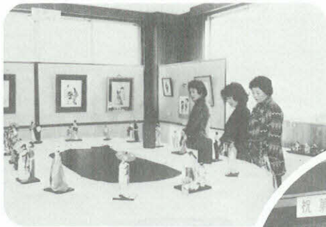
やよい展 働く婦人会館 (3月11日)