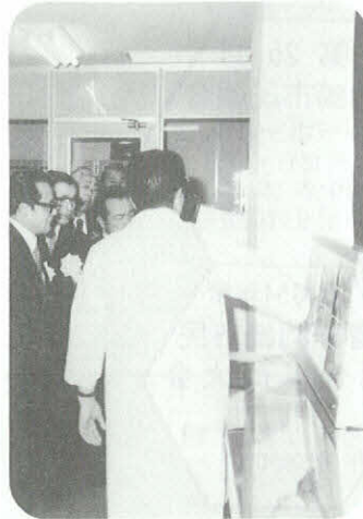
(放射線棟は、年金積立金還元融 資を受けて建設されたものです)