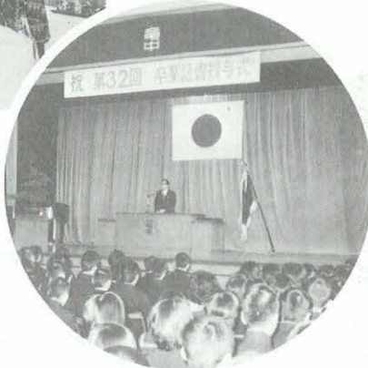
岡崎市婦人会30年史発刊 を祝う会 城北会館 (3月15日)