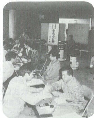
市県民税申告相談 市役所 (3月15日)