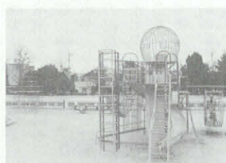
地下駐車場が建設される籠田公園

既設三市営駐車場の運営と、五十四・五十五年度の二カ年継続事業で実施する籠田公園地下駐車場建設を合わせ、特別会計を設置しますが、籠田公園地下駐車場については、都市部の駐車場難の解消と地元商店街の振興を図るもので、地下二階自走式で収容台数は二百十台を予定し、