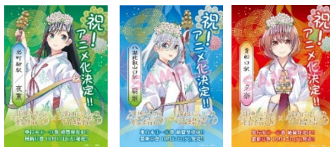
コラボポスターのイメージ