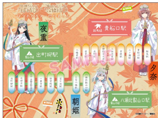
一日乗車券のイメージ