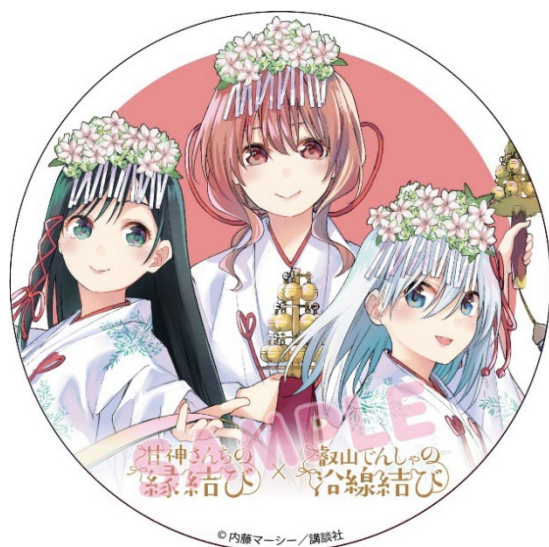
コラボヘッドマークのイメージ