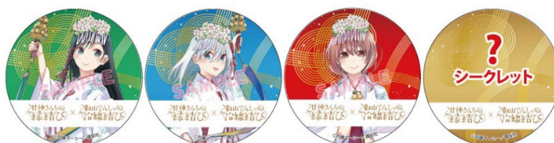
コラボ缶バッジのイメージ