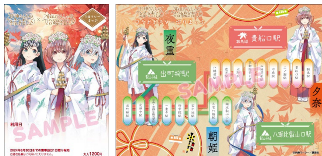
コラボきっぷのイメージ