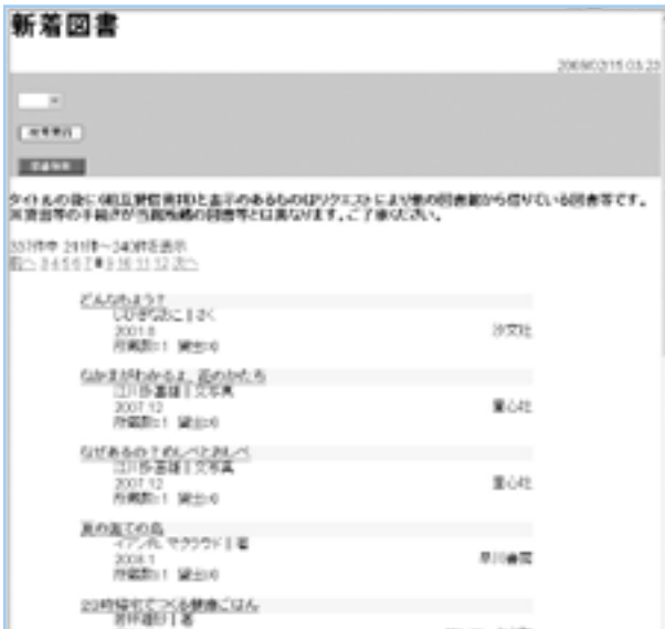
▲本のタイトルをクリックすると 書籍情報を見ることができ、予約することもできます。

ご自宅などのパソコンから、図書館に届いたばかりの本を探したり、予約することができます。どうぞ、お気軽にご利用ください。