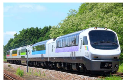
ノースレインボーエクスプレス