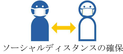
ソーシャルディスタンスの確保