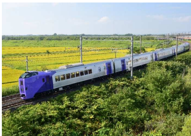
特急フラノラベンダーエクスプレス