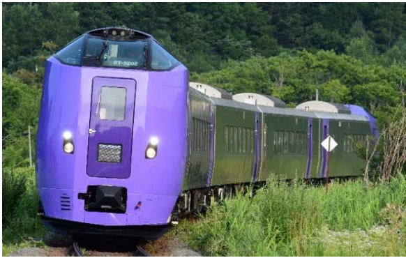
261系5000代「ラベンダー」編成

札幌と富良野を結ぶ便利なアクセス列車を、今年も「ラベンダー」編成で運転します。「ラベンダー」編成は、全車両 Wi-Fi 完備・全座席コンセント利用可能で移動時間まで有効に活用できます。