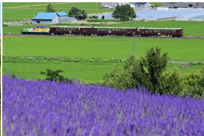
富良野・美瑛ノロッコ号