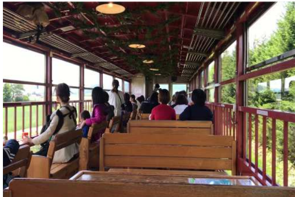
【窓開放による車内換気】