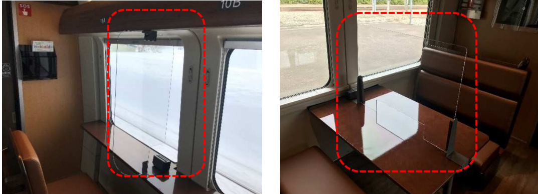
【ラベンダーラウンジ（1号車）へのクリアパーテーションの設置】