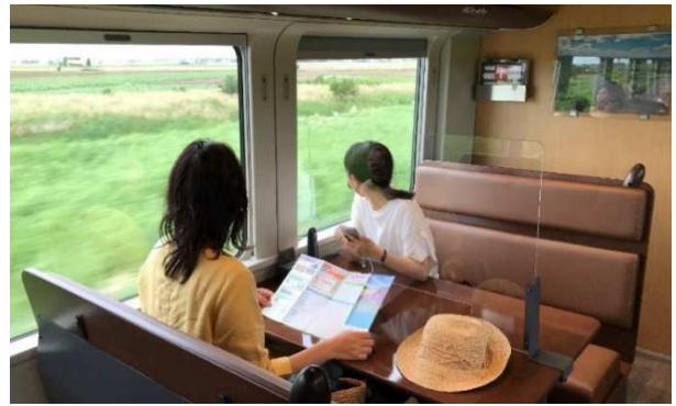
ラベンダーラウンジ(1号車)