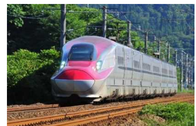
秋田新幹線「こまち」

山形新幹線の全車指定席化にあわせて、従来よりもわかりやすく、ご利用しやすい特急料金に見直します。また、同じ料金体系の秋田新幹線も特急料金を見直します。