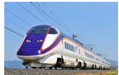
山形新幹線「つばさ」

全車指定席として安心して快適な指定席サービスの提供を通じて、お客さまの着席ニーズにお応えします。