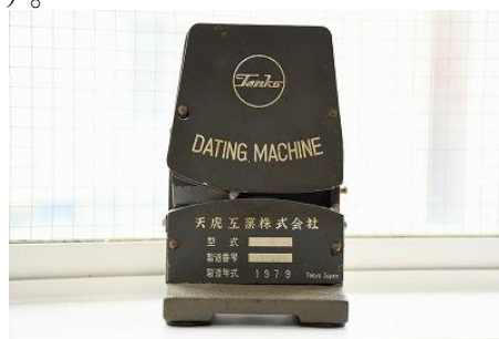
駅での発行日印字に使用するダッチングマシン