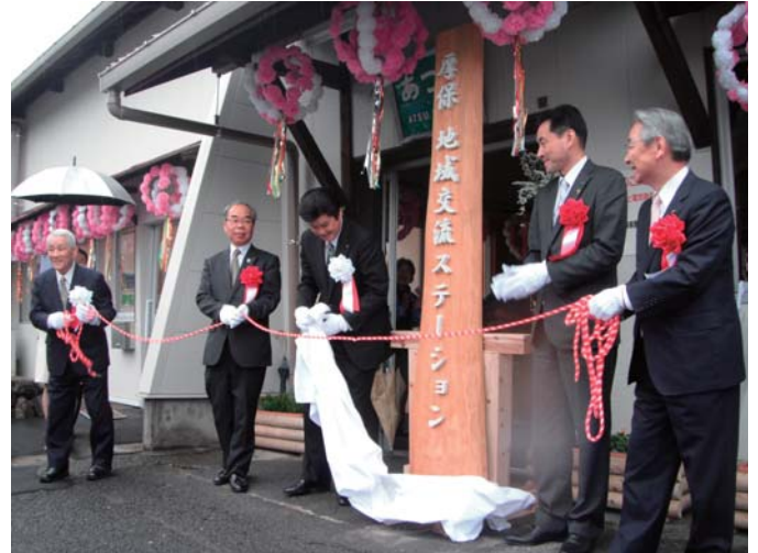
厚保地域交流ステーション

所在地 美祿市於福町下 2831 番地 8 施設概要 会議室 43.6 m 2 和室 4.5 畳 トイレ・湯沸室 開館時間 8時30分～22時 問合せ先 [☎0837(56)0650] 指定管理者 於福地域交流ステーション推進協議会