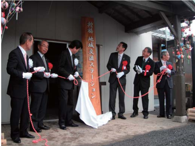
於福地域交流ステーション

地域交流ステーションの供用開始に先駆けて、3月27日(土)に竣工式を催し、於福駅から厚保駅の移動にはラッピング車両が運行されました。また、両地域交流ステーションに、農林中央金庫岡山支店から木質パレットストーブが寄贈されました。