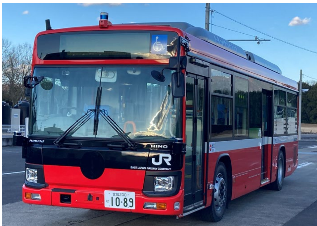
【BRT 専用大型自動運転バスの外観】

JR 東日本では、次世代の公共交通を支える交通手段として BRT 専用大型自動運転バスを製作しました。今回製作した大型自動運転バスは、BRT 線区での自動運転の実用化を見据え、現在 BRT で使用している大型ハイブリッドバスを改造したものです。今後、本格的な実用化に向けてこのバスを用いた走行試験を実施してまいります。