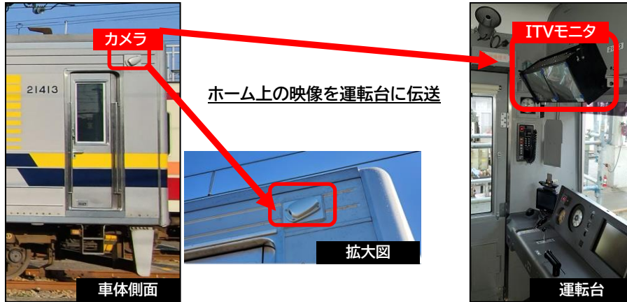
△車上 I T Vシステム

ワンマン運転拡大に合わせ、日光線 栃木～宇都宮線 東武宇都宮間を走行する20400型車両に、車体側面に搭載したカメラでホーム上の安全確認を行う「車上 I T Vシステム」を導入し、ワンマン運転における更なる安全性の向上を図ります。