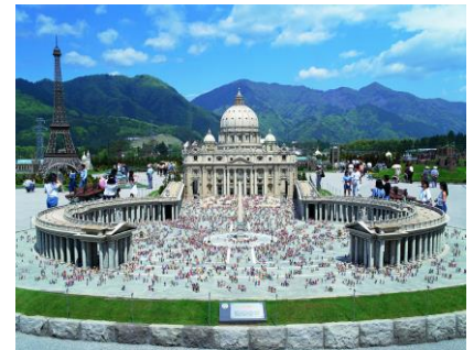
△東武ワールドスクウェア

現在、東武ワールドスクウェア駅には「東武ワールドスクウェア」開園時間のみ列車が停車していますが、開園時間外も含め全ての列車を同駅に停車させることにより、「東武ワールドスクウェア」来園者のみならず、近隣施設等への来訪者の利便性向上を図ります。