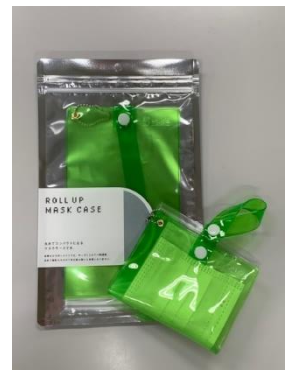
マスクケース・イメージ(今後販売予定) (EkiLab 帯織 試作品例)