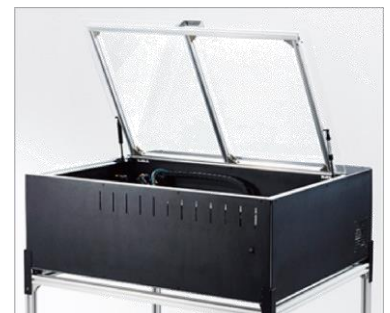
レーザーカッター・イメージ (施設内 設置機械例)