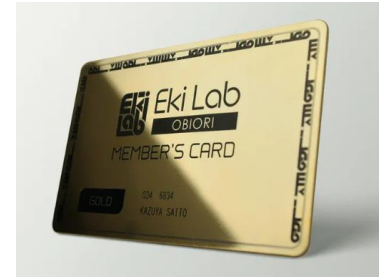
EkiLab 会員証 (イメージ)