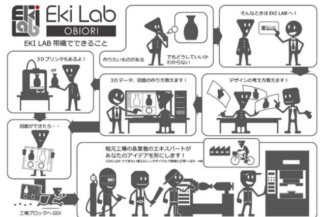
EkiLab 帯織でできること (イメージ)