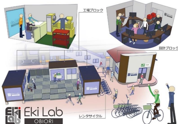
EkiLab 帯織 施設 (イメージ)