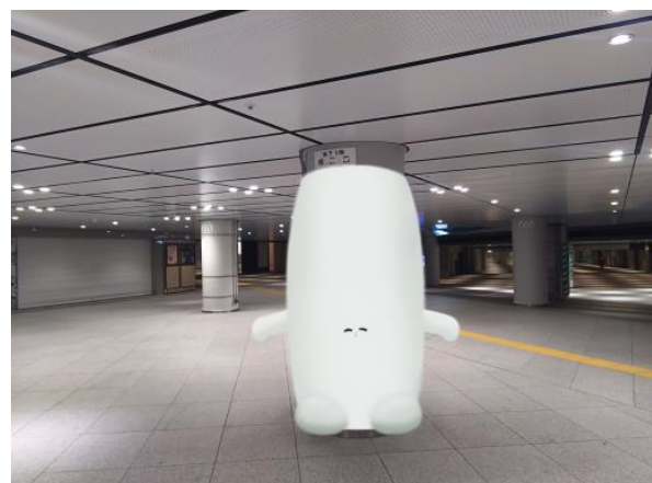
(ふくらむ柱 第3期 イメージ)