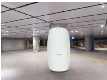
(ふくらむ柱 第2期 イメージ)