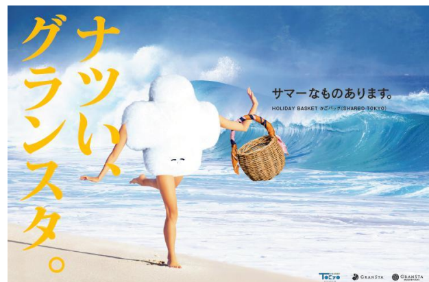
(「ふくらむちゃん」 広告イメージ)