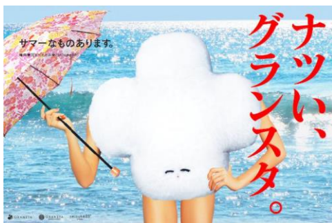
(「ふくらむちゃん」 広告イメージ)