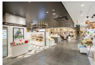
グランスタ新エリア