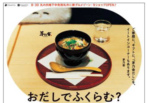
(『ふくらむちゃん』ポスター広告イメージ)