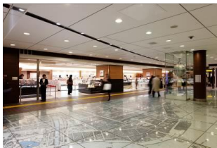
グランスタ「銀の鈴広場」

所在地: 東京都千代田区丸の内 1-9-1 JR 東日本東京駅構内地下 1 階・1 階(改札内) ショップ数: 88(うち販売企画スペース 2 区画) 売場面積: 約 2,850 m 2 業種: デリ、スイーツ、グロサリー、ベーカリー、カフェ、雑貨、コスメ、駅弁など 付帯機能: コンシェルジュ、クローク、外貨両替、免税カウンター、びゅうスクエア、銀の鈴広場 開業日: 2007 年 10 月 25 日 営業時間: 8:00~22:00(日・連休最終日の祝日は 21:00 まで) ※一部ショップにより異なります。 ※グランスタ新エリアは 9:00~22:00(日・連休最終日の祝日は 21:00 まで)