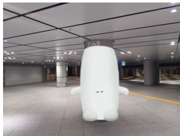
【ふくらむちゃん柱 第3期 イメージ 6月26日(月)公開】