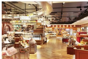
グランスタ丸の内坂エリア