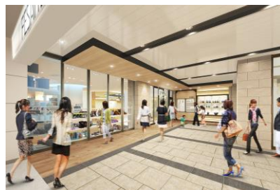
【②1階滝の広場南側入口イメージ】