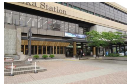
【③滝の広場外観イメージ】