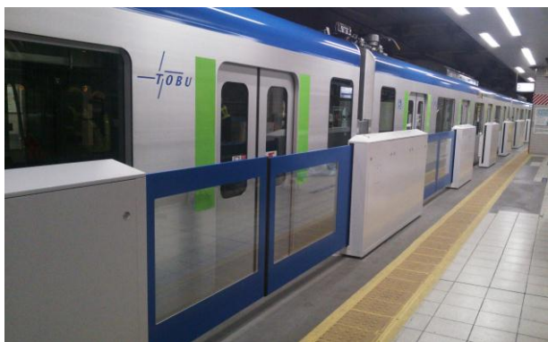
△柏駅 可動式ホーム柵