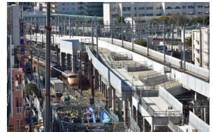
△竹ノ塚駅付近連続立体交差化工事

また、今回のダイヤ改正より伊勢崎線館林以北においては、特急列車以外の一般列車を全てワンマン運転とします。これに伴い、浅草～太田間の直通列車（特急列車以外）については運転を取りやめます。