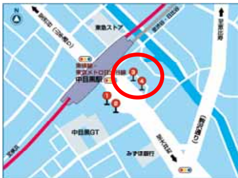
中目黒駅前バス停留所位置