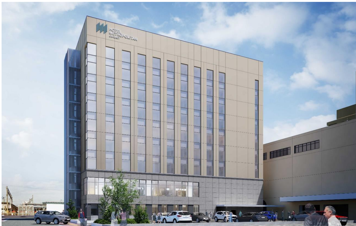
【外観イメージ】（千秋公園側から望む）