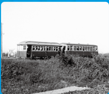
野中停留場(掛川市)