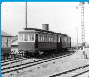
新横須賀駅(掛川市)