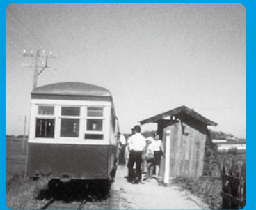
七軒町停留場(掛川市)