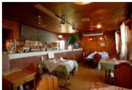
アル・ケッチャーノ（内観）