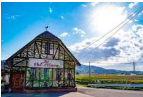
アル・ケッチャーノ（外観）

日本のトップシェフである奥田政行氏は、庄内地方で世代を超えて栽培され、人々に親しまれてきた「在来作物」にこだわった珠玉のイタリアンを、レストラン「アル・ケッチャーノ」で提供しています。奥田政行氏が監修し、「アル・ケッチャーノ」のシェフが調理した“奥田イタリアン”を四季折々のメニューで提供いたします。