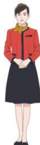
車内アテンダント