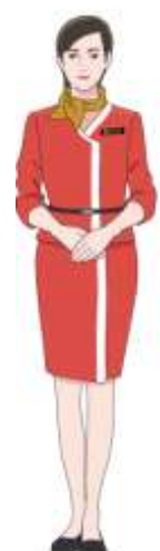
車内アンバサダー