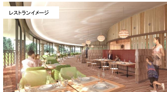
レストランイメージ

長野県の北西部に位置し、北アルプスの山々が広がる自然豊かな山岳観光都市である大町市は、立山黒部アルペンルートの中核として、現在、国内および海外からの旅行者数も年々増加しています。また、スキーリゾートが集まる人気の白馬エリアへもアクセスが良い立地にあります。世界約4,000軒のネットワークを誇る、ホリデイ・インのブランド力により、さまざまな国内外の需要に対応してまいります。