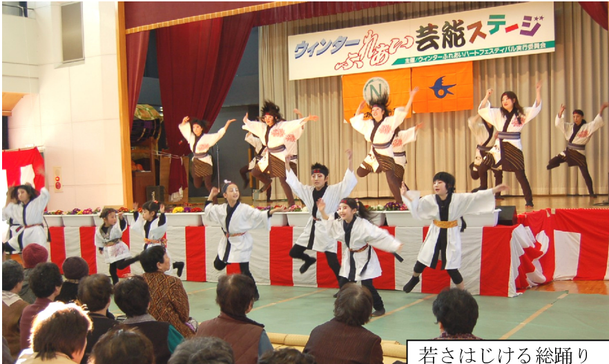
若さはじける総踊り