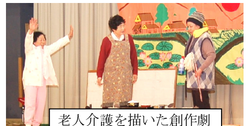
老人介護を描いた創作劇

春を呼ぶまつり『ウィンターふれあいハートフェスティバル』が、2月25日に中之島農村環境改善センターで開催されました。ステージでは小・中学生の演奏や創作劇、総踊り、和太鼓演奏などが繰り広げられました。もちつき大会やお汁粉・こんにやくおでんのサービスなど内容盛りだくさん。体も心もあたたまる一日でした。