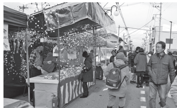
通りにはさまざまな出店が立ち並びました

新春の初市が1月12日に本町・駅前・仲町通りで開催。初あめやだんご木といった縁起物などの出店が立ち並び、多くの人たちでにぎわいました。なかでも、恒例の“鯉こく汁”の無料振る舞い会場には長蛇の列ができる人気ぶりとなりました。