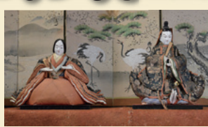
羽田重右衛門家 元禄雛 ちよこんと足の裏を合わせて座る男雛