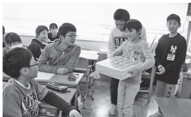
1億円レプリカを手にし、その重さ（10kg）にびっくり