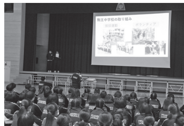
（写真上）山辺中から合唱『ハレルヤ』