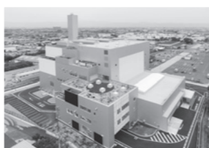
▲エネルギー回収施設 (立谷川)