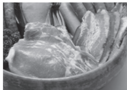
お米で育った「舞米豚」