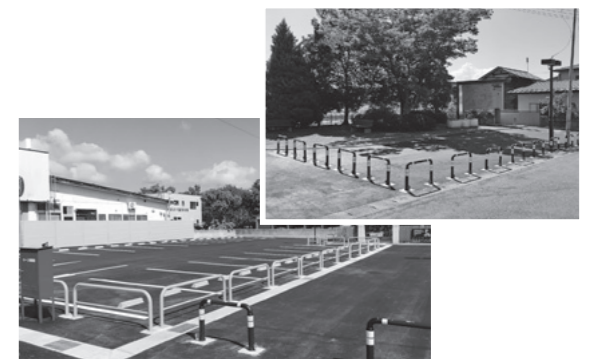
整備された駐車場(左)と広場(右)

しかし、関係機関との協議、検討が進むにつれ、当初予定していた期間内に事業を完了させることが困難になったことから、平成29年度に観光交流センターの建築を除くなど整備内容を見直し、駅周辺整備を行いました。実施した事業内容は、駅利用者や送迎車、町内商店利用者の利便性向上のための「駐車場」と、イベントなど地域の活性化や、憩いの場として利用できる「広場」の整備を行いました(平成30年9月15日号広報やまのべ)や町ホームページでご確認ください。