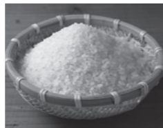
甘みが特徴のお米