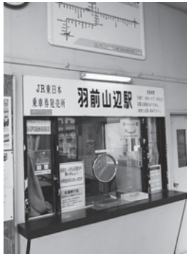
終了する営業窓口

町では、昭和61年11月より国鉄から、現在はJR東日本(株)から乗車券の発売業務を受託し、町直営で運営を行い、平成9年4月からは山辺商業協同組合に再委託して、羽前山辺駅内の営業窓口で普通乗車券、定期乗車券、新幹線特急券を発売しています。 乗車券の発売業務を継続するにあたり、駅舎の老朽化による安全性の確保が課題として残ったままとなりました。 こうしたなか、近年、全国各地で大規模な地震が多発しており、当町でも震度などが同規模程度の山形盆地断層帯地震が想定されています。耐震化が施されていない老朽化した駅舎内に一日中常駐する従業員の安全性を第一に考え、平成31年4月1日より乗車券発売窓口を終了することにしました。