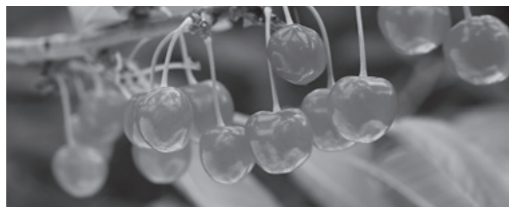
品質の高いさくらんぼ