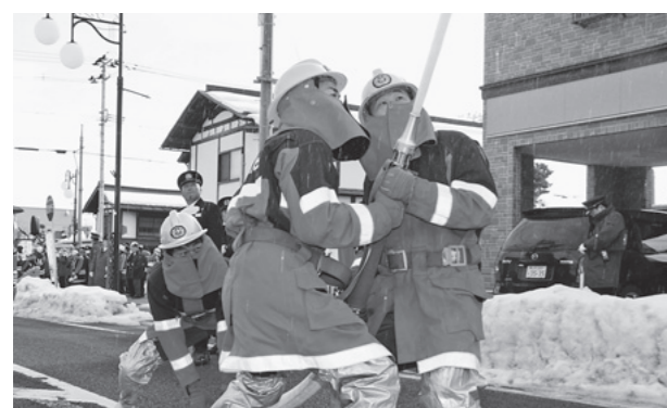
新春を祝う一斉の祝賀放水

町消防団による出初式が、1月13日に開催されました。本町・駅前・前小路通りを会場にした式典では、観閲に続き、新春を祝う祝賀放水や分列行進などが行われ、団員一人ひとりが“町の安全を守る”という使命感を新たにしました。