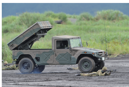
対舟艇対戦車火力による敵の撃破