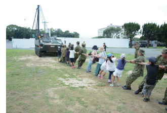
夏休みちびっこ大会