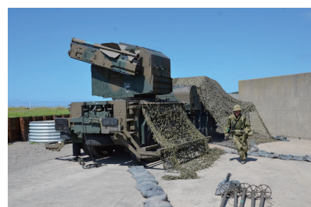
対空火力による敵航空機・ミサイルの撃破