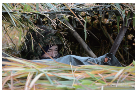
常統的な警戒・監視