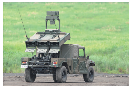
新たに導入された中距離多目的誘導弾