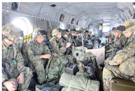
CH-47 による人員の展開