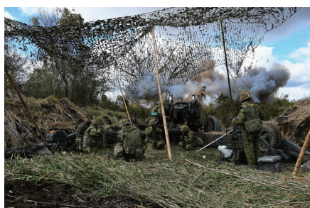
砲迫火力による敵の制圧