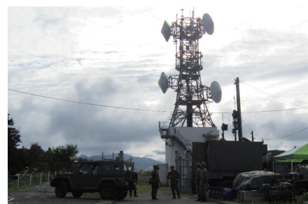
指揮連絡を確保する通信構成