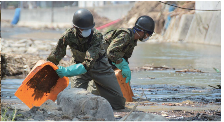
平成30年度7月豪雨災害派遣(平成30年7月)