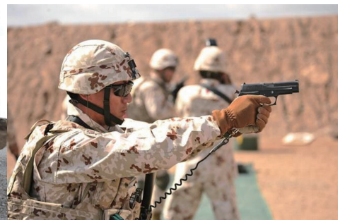
派遣海賊対処行動支援隊(平成29年2月～8月)