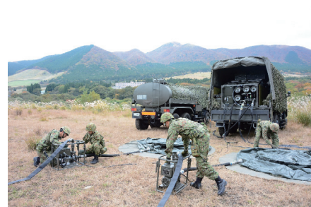
後方支援部隊による兵站基盤の確立