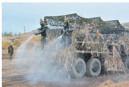
特殊武器防護隊による除染活動