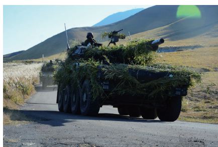
新たに導入された16式機動戦闘車