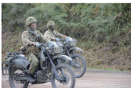
偵察部隊による情報収集