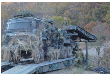
施設科部隊による陣地の強靱化