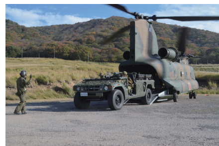
CH-47 による車両の展開