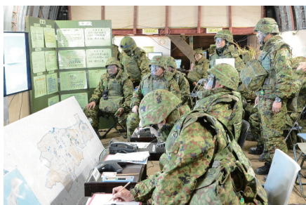
司令部の指揮・幕僚活動