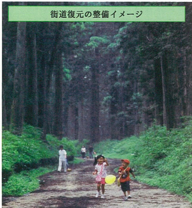
街道復元の整備イメージ

特別天然記念物・特別史跡である「日光杉並木」は、植栽されてから約400年が経過し樹勢が年々衰えてきており、その保護等が課題となっております。そこで県では、「日光杉並木」という本県が誇る貴重な文化遺産を後世に残すため、平成29年3月21日（火）15：00から以下の区間（約1km）の 車両通行止めを実施 いたします。地元関係者や通勤通学の皆様には今後ご不便をおかけいたしますが、ご理解ご協力を賜りますようお願い申し上げます。