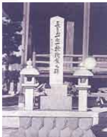
長島一向一揆殉教之碑