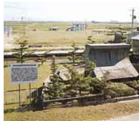
伊勢湾台風復旧仮締切工事完成記念碑