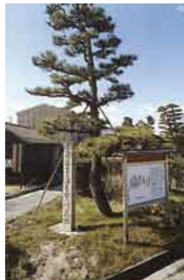
七里の渡し旧跡の碑