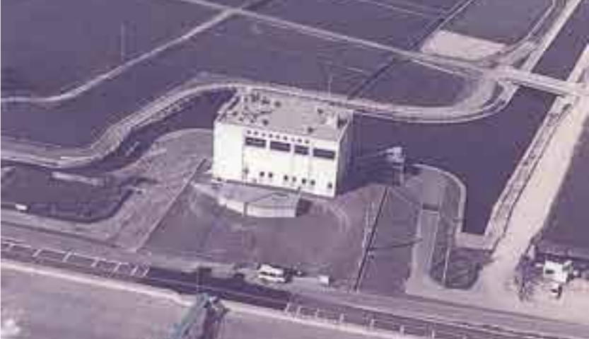
長島排水機場全景

長島輪中では湛水した水を自然に排出することが困難なため、排水機場を各地に設置しています。しかしながら、昭和49・50・51年に深刻な内水被害が発生。このため建設省では、昭和57年から長島川流末に長島排水機場の建設を開始。全体排水計画では10m 3 /秒のうち、現在、4m 3 /秒のポンプが2台設置されています。さらに長島川や用水・排水路の整備が進み、長島輪中内の排水系統は、千倉・福豊・大島・松蔭の四系統で整備されています。