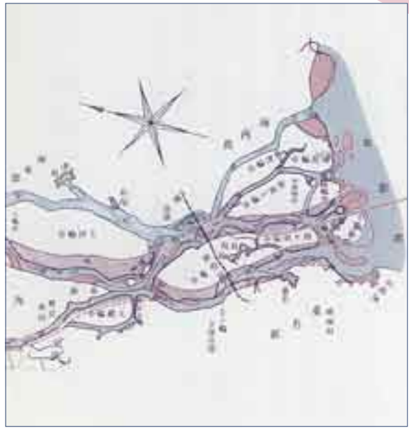
木曾長良撰斐三川改修計画図(明治改修当時)