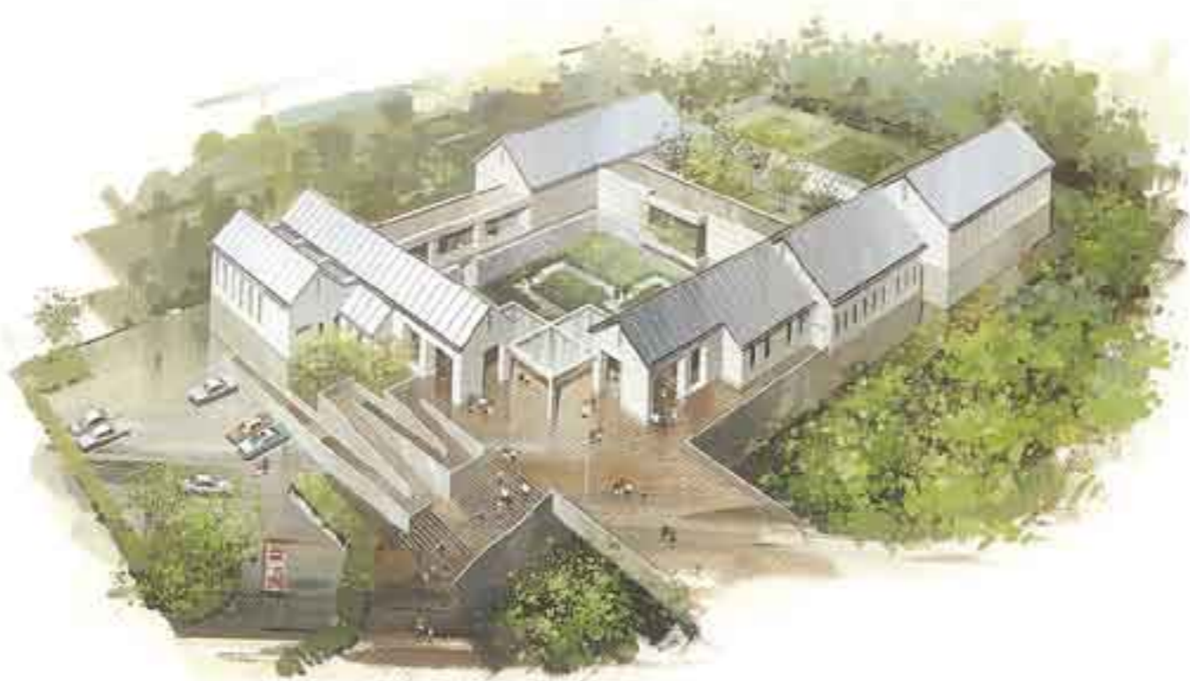
輪中の郷ふるさとセンター完成予想図

尾張の宮と桑名の間は、有名な「七里の渡し」。干満の差や、天候、船の大小によって、いろいろなルートが利用されましたが、17世紀末になると、満潮時の木曾川と長良川を結ぶ航路は、青鷺川と白鷺川に固定。しかし、明治20年代の河川改修によって青鷺川は廃川となり、埋め立てられました。現在は国道23号線が通り、往時の面影はなくなりました。