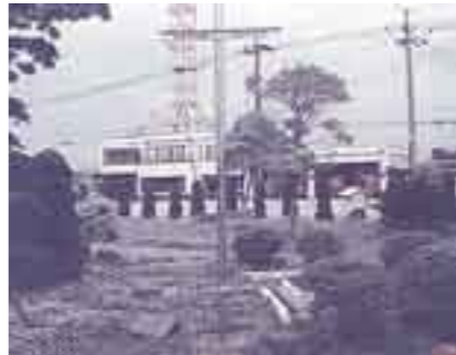
長島町役場前の地盤高と潮位の関係を示す表示板

長島町白鷄地区内の地盤沈下は、昭和36年から平成2年までの累積で一五八cmに及ぶ沈下量を記録。常に高潮、洪水、内水氾濫等の不安がつきまとっています。このため東海三県で地下水汲揚規制と地下水監視を実施。年間の沈下量は昭和50年をピークに減少、同55年頃からは僅かな沈下量と