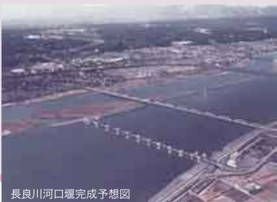
長良川河口堰完成予想図

堰上流部の淡水化された水の一部は都市用水として、毎秒最大22.5m 3 を供給。地盤沈下の進んでいる濃尾平野で地下水汲み上げの肩代わりの一助ともなり、中部圏にとって重要な事業となっています。