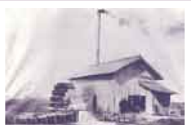
大正時代の排水機場

木曾三川の河口にできた三角州が変貌して島となった長島町は、島を水から守るため、輪中が作られました。用・排水は潮の干満に委ねられ、各集落の外面に水門を建てて水の管理に当たり、『水守』役員制度発足しました。 明治38年には千倉に初の二段式蒸気機関による排水機場を設置。満潮時には休止しなければならなかつた自然排水に比べ、大いに能力を発揮。大正6年、蒸気による水車式排水機を近代的な、渦巻式スクリーンポンプに改良。煉瓦造りの大煙突が建てられ、一時は長島町の風物ともなっています。昭和6年には、蒸気機関を廃し、電動機に改良。湛水の被害も減少し、豊かな実りの秋を迎えたと伝えられています。