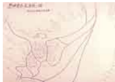
熱田桑名渡海之図

水辺ではマリンスポーツが花盛り。ジェットスキーやウィンドサーフィンなど、アクティブ派の若者たちが各地から集まります。