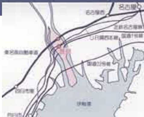
長島町長期総合計画

明治時代には、近代的治水事業・明治改修が行われ、長島は現在のような地形となりました。その後、昭和34年(1959)の伊勢湾台風により、ほぼ全町が水没。壊滅状態に陥りましたが、人々の努力により完全に復興。現在は「第2次長島町長期総合計画」のもと、21世紀に向けて、積極的なまちづくりに取り組んでいます。