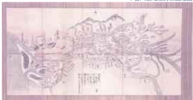
木曾川筋尾濃勢三国之図

尾張の織田信長と一向宗の願證寺の間に起こった戦いは、日本の歴史でも、最も悲惨な戦いであったといわれています。親鸞上人による浄土真宗は八世蓮如の頃、教勢が著しく拡大。蓮如の子蓮淳が、長島の杉江にある願證寺の寺主に迎えられるのは、明応6年(1497)のこと。当時長島は伊藤一族の支配下にありましたが、その圧政に耐えかねた農民が願證寺に集結。一族をこの地より追い払い、事実上の支配権を握るようになりました。願證寺は信長に追われた落武者を受け入れてからさらに強大化。元龜2年(1571)、3回に渡る信長との決戦が始まったのです。網の目のように入り組んだ木曾三川河口や輪中地帯の利点を生かし、最後まで抵抗した長島城も天正2年(1574)には落城。『死ねば極楽』と勇敢に戦った一向宗門徒の多くは殉死。その願證寺は明治の河川改修により、今では長良川の河床に沈んでいます。