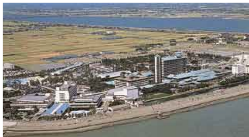
長島温泉スパランド