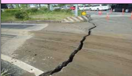
国道3号 熊本市南区富合町杉島 路面沈下、ひびわれ