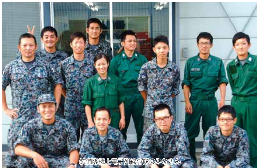
整備機上電子列線分隊のみなさん

また、航法装置とは航空機が飛行する際、GPS等の電波から自分の現在位置を割り出し、出発地点から目標地点まで、正確かつ安全に飛行するための器材で、空のカーナビのようなものです。