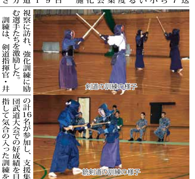
銃剣道の訓練の様子