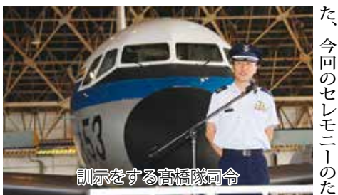
訓示をする高橋隊司令

2点目は、安全について基本手順の徹底、各部隊の運用環境に合わせた安全施策の推進等、事故の再発防止に丸とらえて取り組むこと。我々は二人の隊員も仲間も失わない、二つの装備品も失わない」という強い意志と行動を常に肝に命じておくこと。