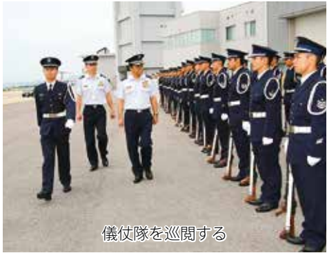
儀仗隊を巡閲する

午前11時50分、U4型輸送機で到着された齊藤空幕長はエプロン地区において、美保基地司令・高橋一佐以下主要幹部の出迎えを受け、幹部挨拶、状況報告を受けた。