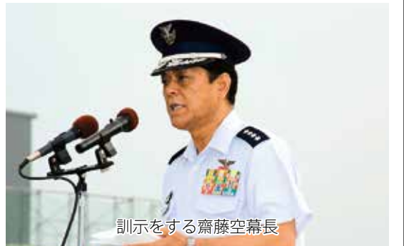
訓示をする齊藤空幕長

ため新たに建設された施設等の視察を実施され、その後、東グラウンドにおいて基地所属隊員に対して訓示された。