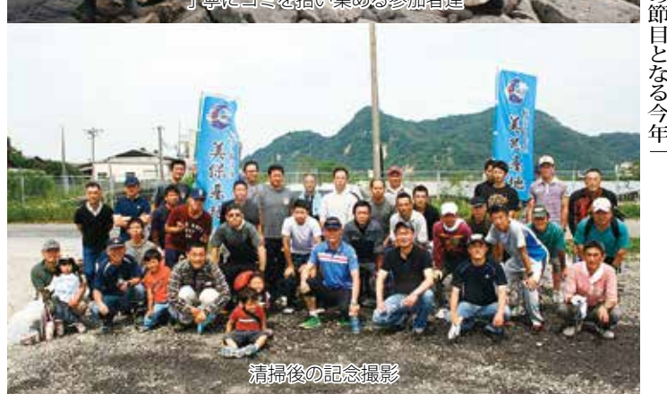
清掃後の記念撮影

隊員と家族がボランティア活動！ 中海・宍道湖一斉清掃 美保基地は6月14日(日)、を記念して2006年から「境港一斉清掃」に参加し、実施されているものである。この一斉清掃は、中海・宍道湖がラムサール条約に基づく湿地帯に登録されていることから10年目の節目となる今年 は基地から幹部会、准曹会とその家族を合わせて84名が清掃活動に参加した。清掃は外江港、西工業団地北・西側湖岸で実施され午前8時30分から約1時間半、中海の湖岸に打ち上げられたゴミを丁寧に拾い集めた。