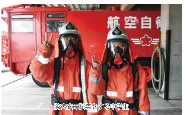
防火衣の試着をする中学生

初日は、基地資料館において、美保基地の概要について説明を受けた後、敬礼動作等の教育を受けて美保基地での体験学習を開始した。管制塔を見学した生徒たちは「初めて、管制塔での管制の仕事やC1の修理やT400のコックピットを見るのが出来て感動した。」と口々に述べ、当初緊張していた表情は徐々に笑顔に変わっていった。 4日間の体験学習を終えた生徒たちは「基地の中に消防や警察、病院の様なものまであり、とても驚きました。隊員の人が皆とても優しく安心しました。」「重たい装備を付けて素早く動き回る隊員やテキパキと仕事を、質問に何でも答えてくれる隊員がとてもカッコ良かったです。将来自衛官になりたいです。将来の感想を述べ、充実した体験学習を無事終了した。