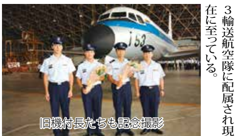
旧機隊長たちも記念撮影

その後、参加した隊員全員で記念撮影を実施し、用途廃止のセレモニーを無事終了した。