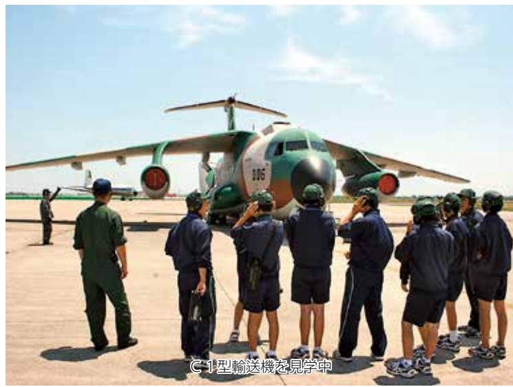
C1型輸送機を見学中

今年も体験学習を支援！ 境港第二中学校の10人が参加 毎年実施されている同体験学習は、「みんなでないや地域の先生」をテーマに地域を愛し、地域の人々と共に生きる喜びや感謝の心を育み、「生きる力」の基礎となる豊かな人間性や自ら課題を見つけ解決していくこととする意欲・態度を育成することを目的に行われたものである。 期間中、生徒たちは管制隊の管制塔をはじめC1、YS11、T400各航空機の見学をするなど体験学習