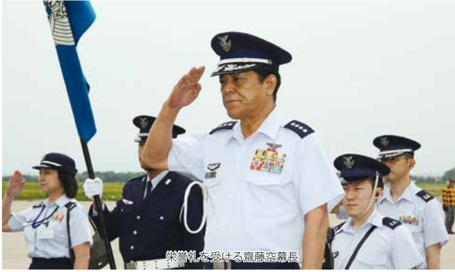
名誉礼を受ける齊藤空幕長

午前11時50分、U4型輸送機で到着された齊藤空幕長はエプロン地区において、美保基地司令・高橋一佐以下主要幹部の出迎えを受け、幹部挨拶、状況報告を受けた。