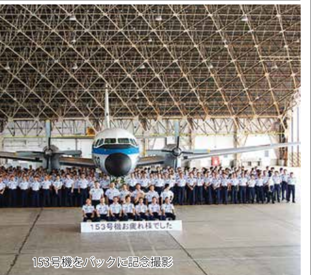
153号機をバックに記念撮影

同機は、大喪の礼、即位の礼において外国のVIP空輸を実施、また、阪神淡路大震災においては、天皇皇后両陛下の行幸啓、内閣総理大臣及び国土交通大臣