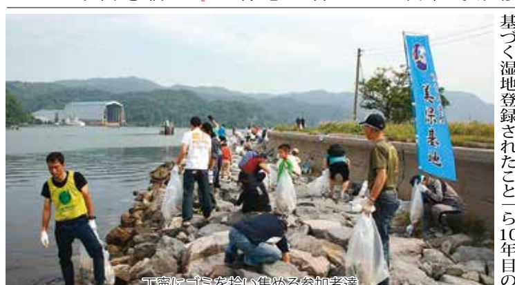
丁寧にゴミを拾い集める参加者達

基地モニター等11名は、6月26日、高尾山分屯基地(島根県松江)を見学した。 研修は、高尾山分屯基地の任務等概況について第7警戒隊の担当から説明を受けた後、オペレーターサイトに移り、領空侵犯機に対する措置やレーダーサイトについて説明を受けた。 高尾山山頂(標高332M)へ移動し、レーダー関係の器材の説明を受けながら見学をした。 当日は、生憎の雨で弓ヶ浜半島の絶景を満喫することは出来なかったが、研修を受けたモニターの方々は「私たちが知らない所でも、しっかり国を守ってくれている」ということを、今回の研修で初めて知りました。 24時間、常に国の安全を守っている航空自衛隊の皆さんに改めて感謝の気持ちを持ちました。今後の研修もとても楽しみです。」との感想をいただき、高尾山部隊研修を無事終了した。