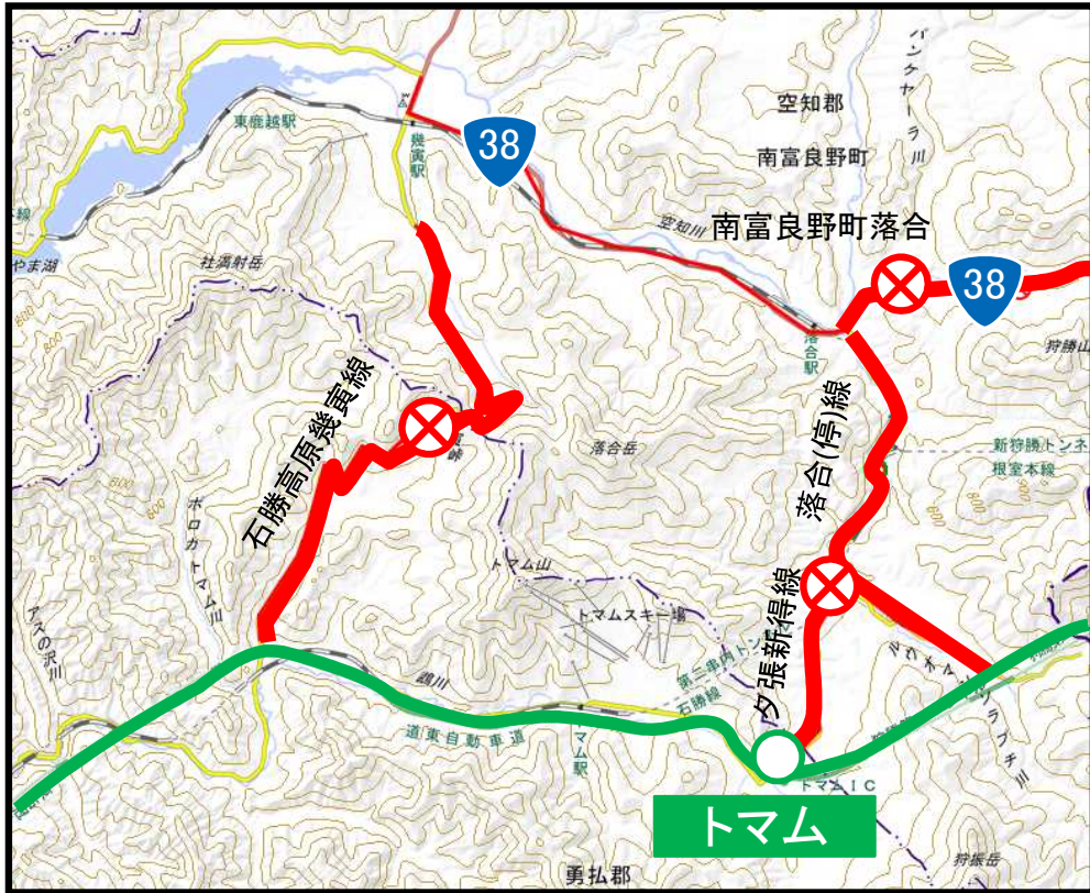
トマムIC付近拡大図