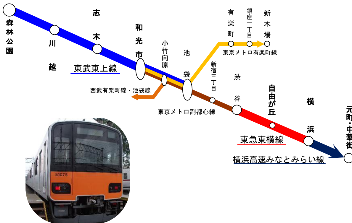
△東急東横線、横浜高速みなとみらい線に乗り入れる50070型車両