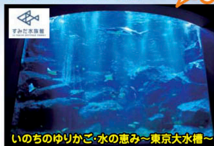
いのちのゆりかご・水の恵み～東京大水槽～