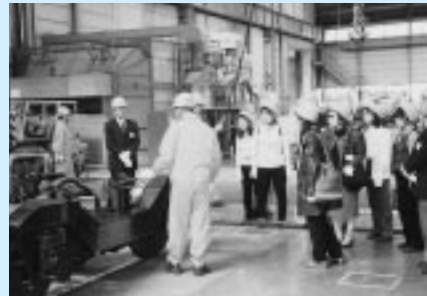
車両工場内を見学する交通モニターの皆さん

これから1年間、皆様からご意見やご提案をいただき、サービスの向上や施設の改善に役立ててまいります。