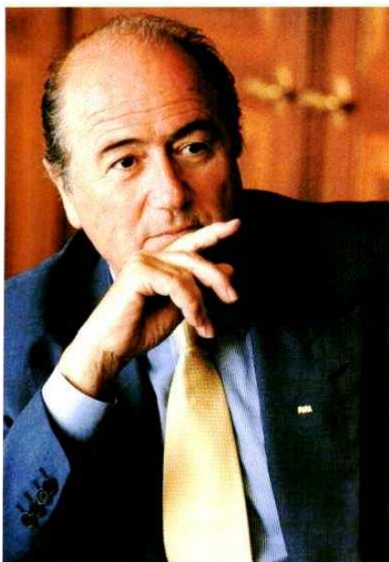
Joseph S. Blatter, FIFA President

Part of the secret to achieving that effect may be to remodel the women's football calendar, just as we are having to