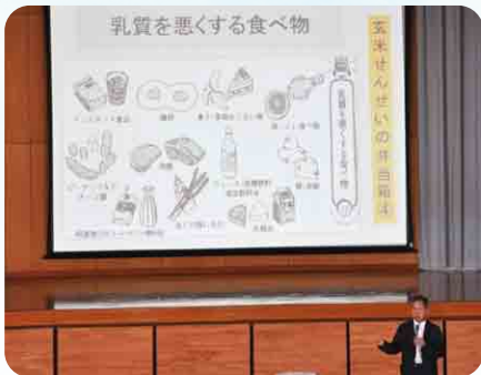
お弁当の日講演会