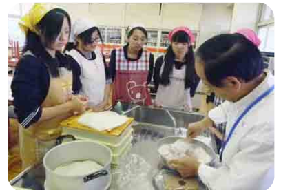
フードデザイン和菓子作り講習会