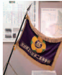
平成8年まで使用されていた校旗 (思い出の部屋収蔵)

太田二高がある周辺は「山吹の里」と呼ばれ、長い歴史を偲ばせる文化財や豊かな自然に恵まれています。