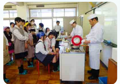
お弁当づくり講習会