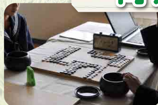
囲碁将棋部同好会