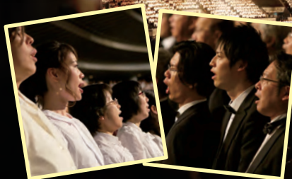
第32回「サントリー1万人の第九」より

主役はあなた。佐渡裕の指揮のもと、ゲストやオーケストラと大阪城ホールで共演しましょう。