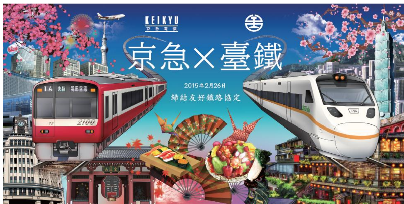
友好提携記念ポスターイメージ

今回の提携を契機に、台鉄、京急も各種取組を通じて両者沿線のみならず、日台間の交流人口の増大を目指すべく活動してまいります。詳細は別紙のとおりです。