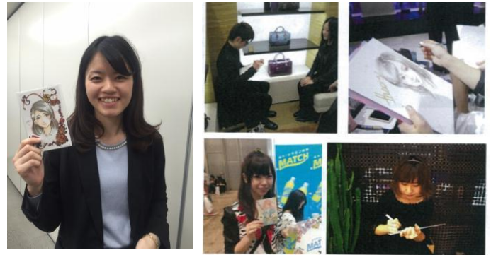
マンガデザイナー似顔絵イベントイメージ