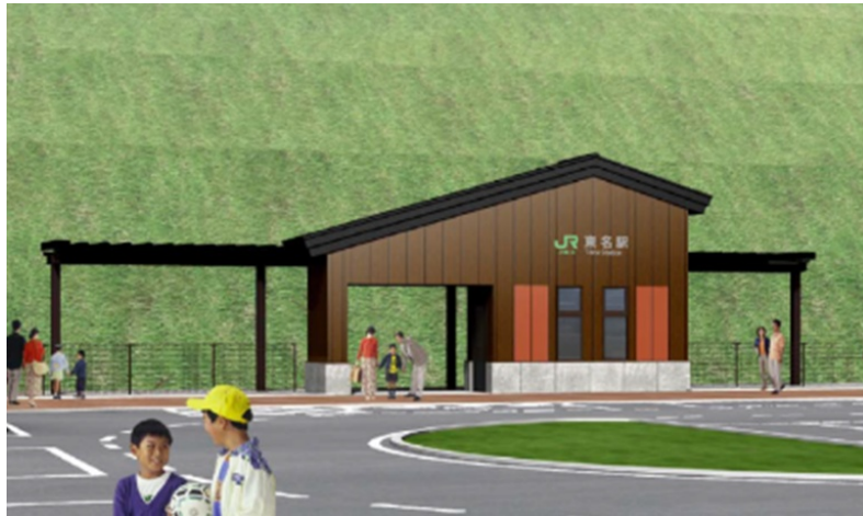
東名駅舎(イメージ)