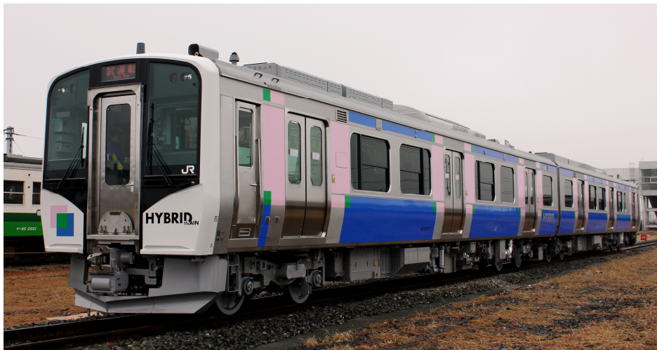
ディーゼルハイブリッド車両 HB-E210 系