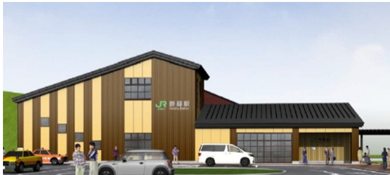
野蒜駅舎(イメージ)