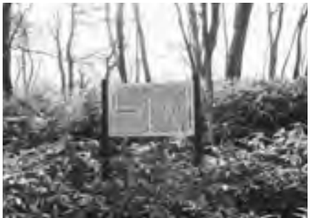
【写真①】 坊主窪古墳群第一号墳

要害古墳群第一号墳（町指定第二十二号【写真③】）は方墳で、出土した土師器により古墳時代前期の四世紀につくられた古墳であることが判明したが、山形盆地で最古となる古墳である。墳頂部の調査の結果、二度にわたり埋葬がなされた可能性があるという。 三つの古墳ともに、県内でも独特の位置を占めている貴重な存在である。