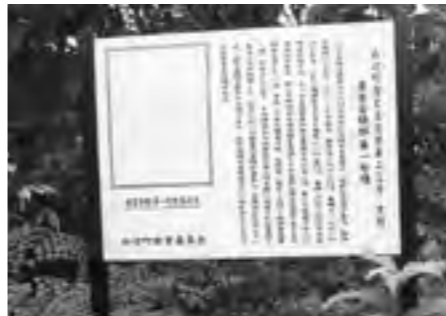
【写真③】 要害古墳群第一号墳