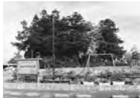
【写真②】 大塚天神古墳