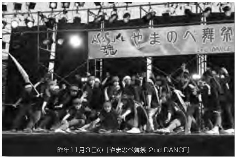
昨年11月3日の『やまのへ舞祭 2nd DANCE』