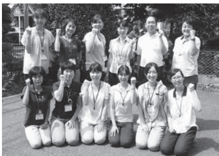
お待ちしております！

特定保健指導は、特定健康診査の受診結果をもとに、保健センターの保健師、管理栄養士が、生活習慣を改善するために、継続的な助言や支援を6か月間実施するものです。さらに、食事内容を改善してみようと行動に移すきっかけとなるようなサポートも受けられます。