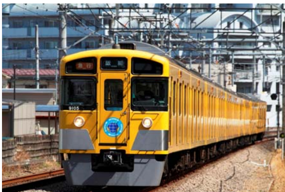
塗色変更前の西武鉄道 9000 系車両（イメージ）