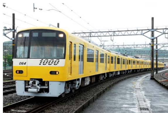
京急電鉄「KEIKYU YELLOW HAPPY TRAIN」