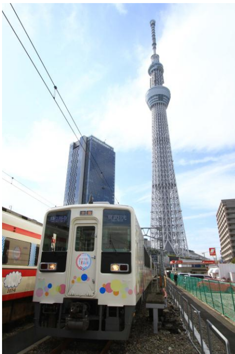
△東京スカイツリーとスカイツリートレイン