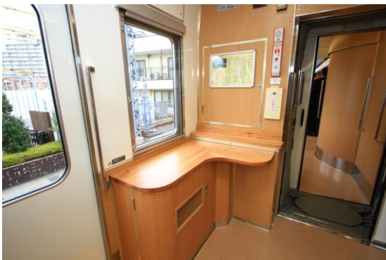
△カウンターテーブル

※一般的に社寺内に多い樹齢100年以上のものを御神木と呼びますが、このテーブルは、御神木と 呼ぶにふさわしい樹齢約400年の日光杉の古損木を使用しています。なお、古損木の売却で得た 資金は、日光杉並木の保護などにあてられています。