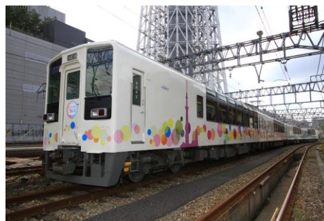
△スカイツリートレイン（側面）