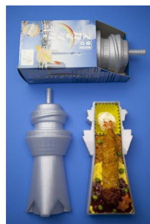
△東京スカイツリー弁当 (1,000円(税込))