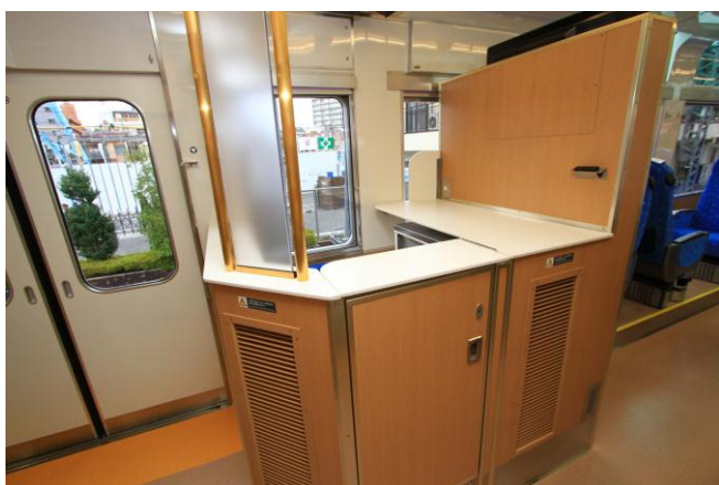
△サービスカウンター

サービスカウンターで軽飲食や限定商品などを販売いたします。(スカイツリートレイン 2号・3号を除く)