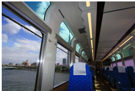
△展望窓からの風景（隅田川）