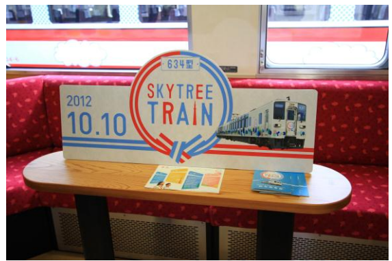
△記念撮影ボードと記念乗車証 (イメージ)

楽しい旅が思い出に残るようスカイツリー トレインのロゴと日付入り記念撮影ボードを、 サービスカウンターで貸出いたします。 (スカイツリートレイン2号・3号を除く)