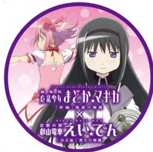
鞍馬・八瀬比叡山口 側