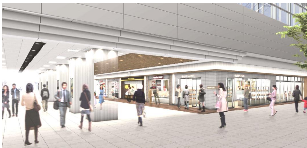
△「EQUIA松原」外観イメージ