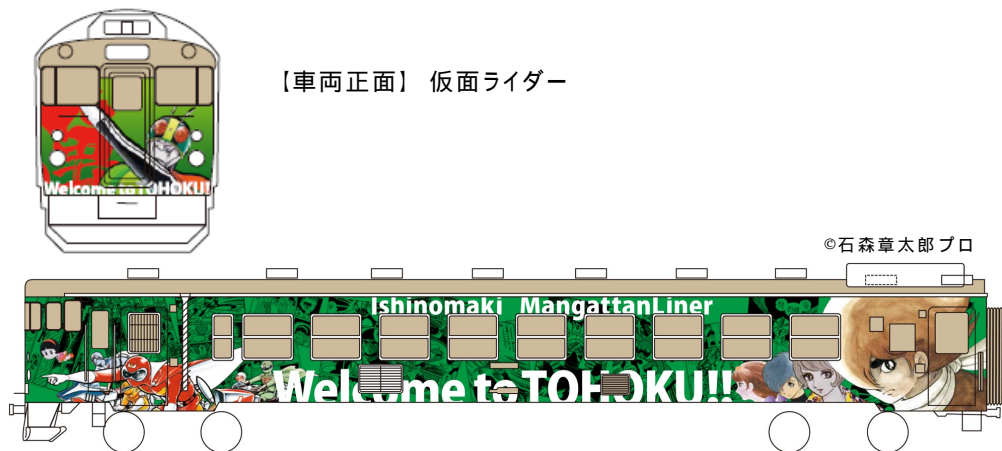
【車両正面】 仮面ライダー