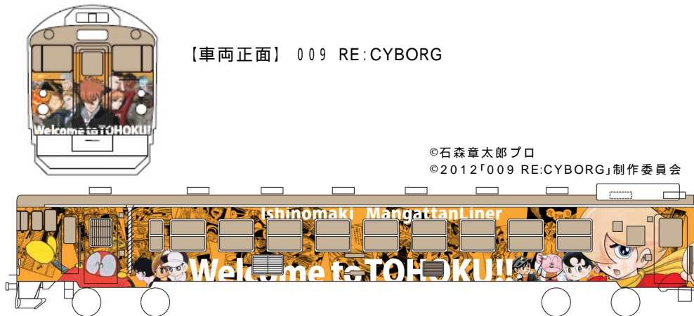
【車両正面】 009 RE:CYBORG

【車両側面(左から)】 さるとびエッチちゃん、秘密戦隊ゴレンジャー、 千の目先生、ジュン、009ノ1、サイボーグ009