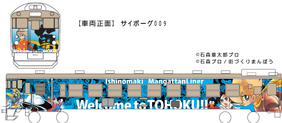
【車両正面】 サイボーグ009

【車両側面(左から)】 仮面ライダー、ロボット刑事、人造人間キカイダー、秘密戦隊ゴレンジャー、 ちゃんちきガッパ、ドッグワールド、ザ・スターボウ、サイボーグ009