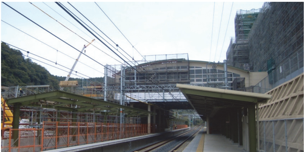
建設が進む「和歌山大学前」駅(11月5日時点)